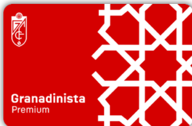
CARNÉ GRANADINISTA PREMIUM