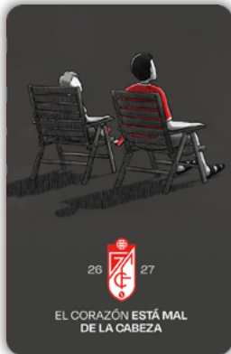
ABONO PRIMER EQUIPO