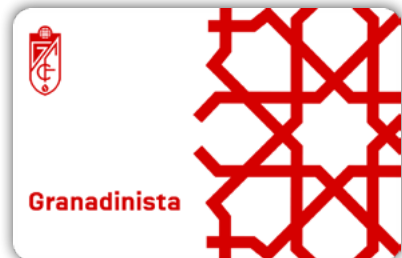
CARNÉ GRANADINISTA GRATUITO